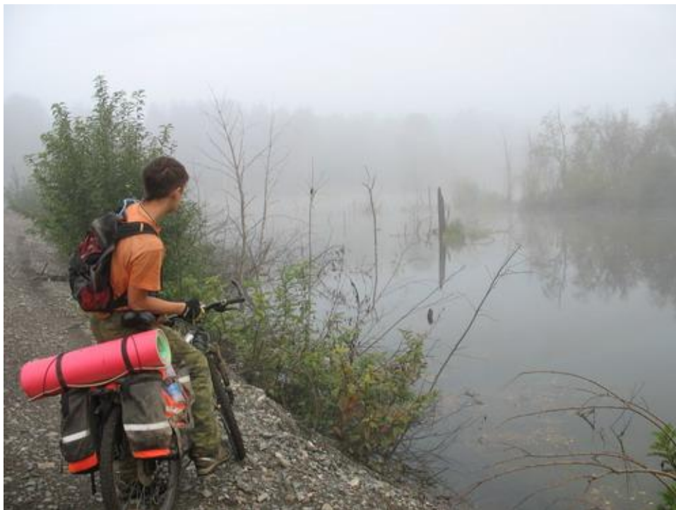
Фото № 28 По пути в Минку

Утром опустился густой туман. Вышли в 10.00. Двигались вдоль ЖД по насыпи до ст. Минка.