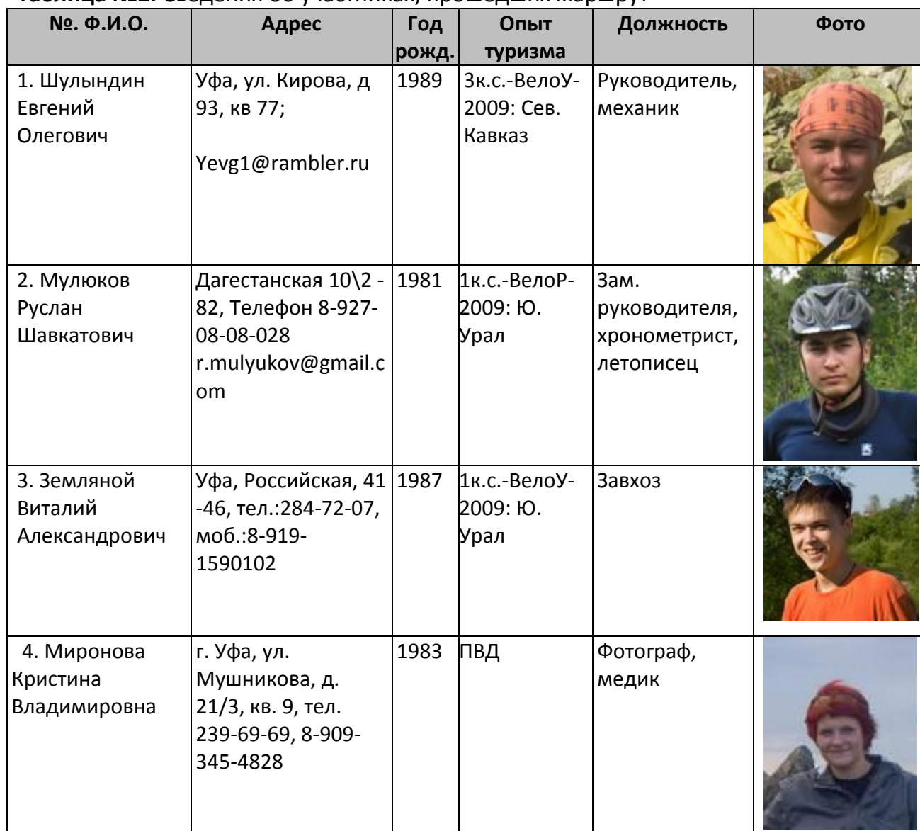
Таблица №2. Сведения об участниках, прошедших маршрут