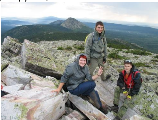
Фото № 4 На вершине Круглицы

В 16.50 вышли к приюту Таганай и после перекуса, спрятав велосипеды, совершили радиальный пеший выход на вершину г. Круглица.