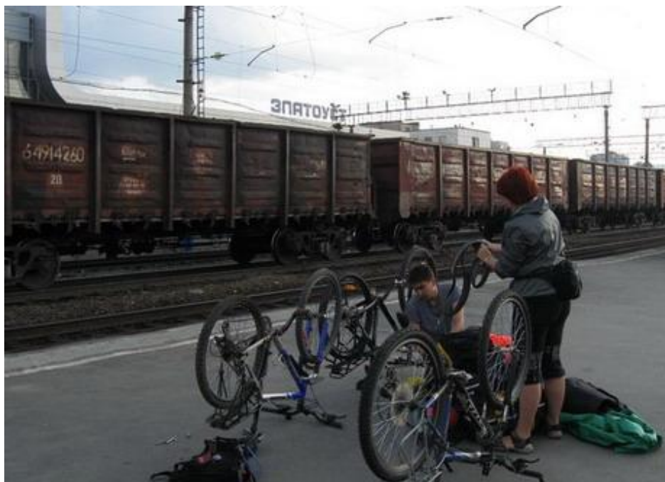
Фото №1 В Златоусте

Прибыли поездом в Златоуст в 8.40, собрали, отрегулировали велосипеды, поменяли Кристине покрышку на заднем колесе. В Златоусте же купили продовольствие на 2 ходовых дня.