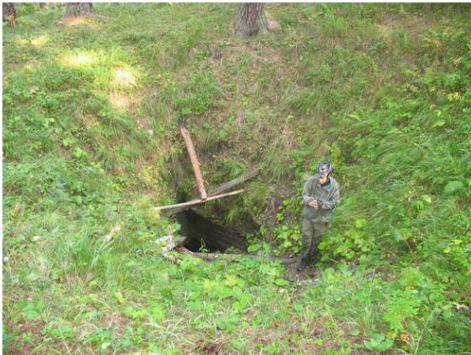
Фото № 29 Вход в пещеру Минка

В 12 часов продолжили движение. 2 км по главной улице Минки и налево – в сторону Усть-Катава.