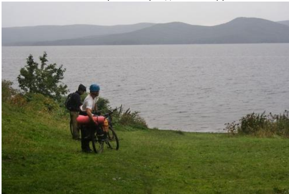
Фото №9 Тургояк.Приехали на стоянку

На одной из баз на оз. Тургояк в это время проходил рок-фестиваль «Уральский рубеж», мы подоспели к его закрытию. В пос. Тургояк приехали в 20 часов, закупили продукты и встали на живописную стоянку под скалами Крутики.