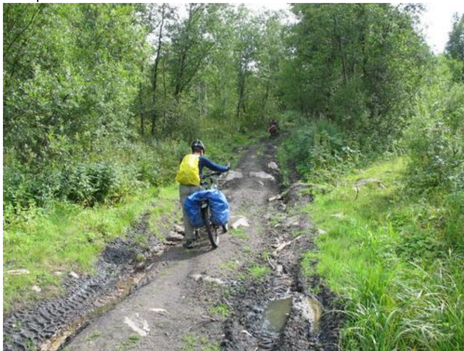
Фото№7 Подъем на пер «Горелый»

Пообедали и в 15.00, перейдя р. Бол. Киалим, начали подъем на перевал «Горелый». Подъем достаточно пологий, за 8 км набор высоты – 210м. Дорога каменисто-грунтовая, местами с промоинами.