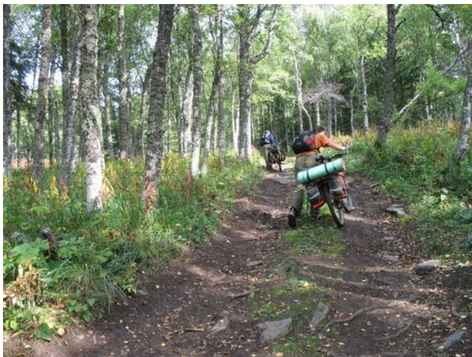
Фото №20 Подъем на хребет Аваляк

На маршрут вышли в 9.40. Солнечно. От стоянки на северо-запад уходит дорога, ведущая к перевалу хр Аваляк. Характер покрытия: сильно пересеченная вездеходная дорога со значительными неровностями, торчащими корнями. На перевал поднялись в 11.30.