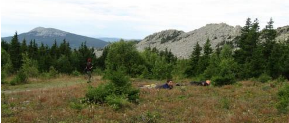
Фото №6 Группа за поеданием ягод на Дальнем Тагане

Утром ремонтировали прокол переднего колеса у Кристины. Вышли в 9.50. Доехали до ур. Стрелка, спрятали велосипеды и пошли пешком на г. Метеопик. В это время тундра, окружающая метеостанцию изобилует голубикой, сбор которой, однако, запрещен, т.к. место причисляется к памятникам природы.