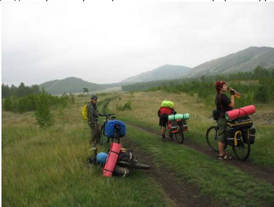
Фото № 16 Едем в Шарипово

В 11.15 начали движение по дороге, пролегающей восточнее хребта. Моросил дождь. На подъезде к Шарипово Руслан прокалывает колесо. Быстро ремонтируем.