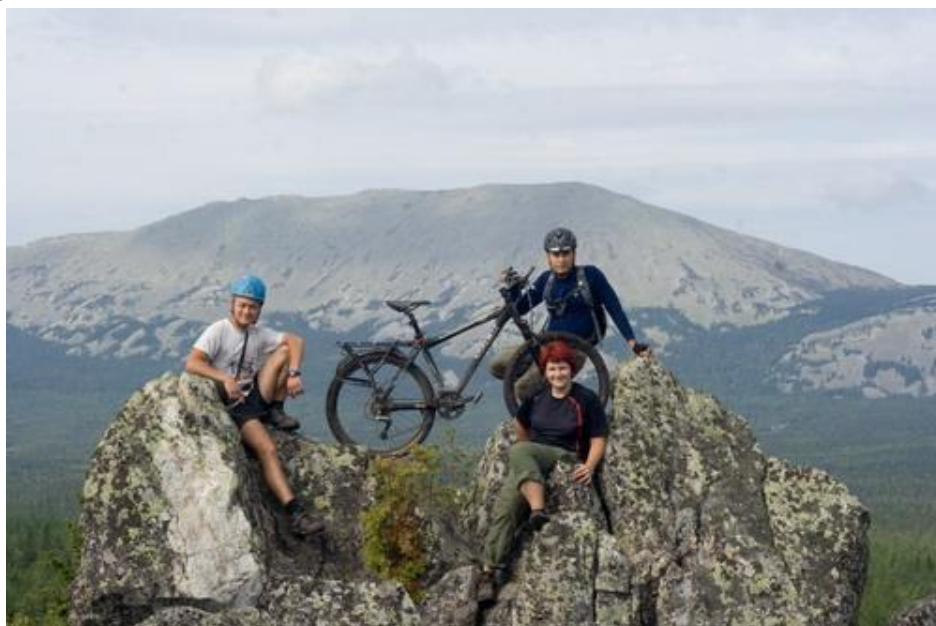
Фото №20 На хребте Аваляк

Дальше двигались по туристско-конной тропе, которую только в 5 км до Тюлюка можно назвать дорогой. Покрытие: утопанный чернозем, скользкий местами, торчащие курумы.