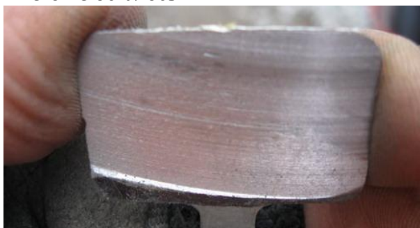
Фото № 10 Стертая тормозная колодка

Утром мыли велосипеды, ремонтировали Кристине порванную цепь. Выехали в 10.00, поехали в магазин велоапчастей за тормозными колодками для велосипеда Руслана. Отсутствие продавца задержало нас на 40 минут. Колодки купили; когда меняли, выяснилось, что старые были стерты настолько, что даже от распирающих пружинки уже почти ничего не осталось.