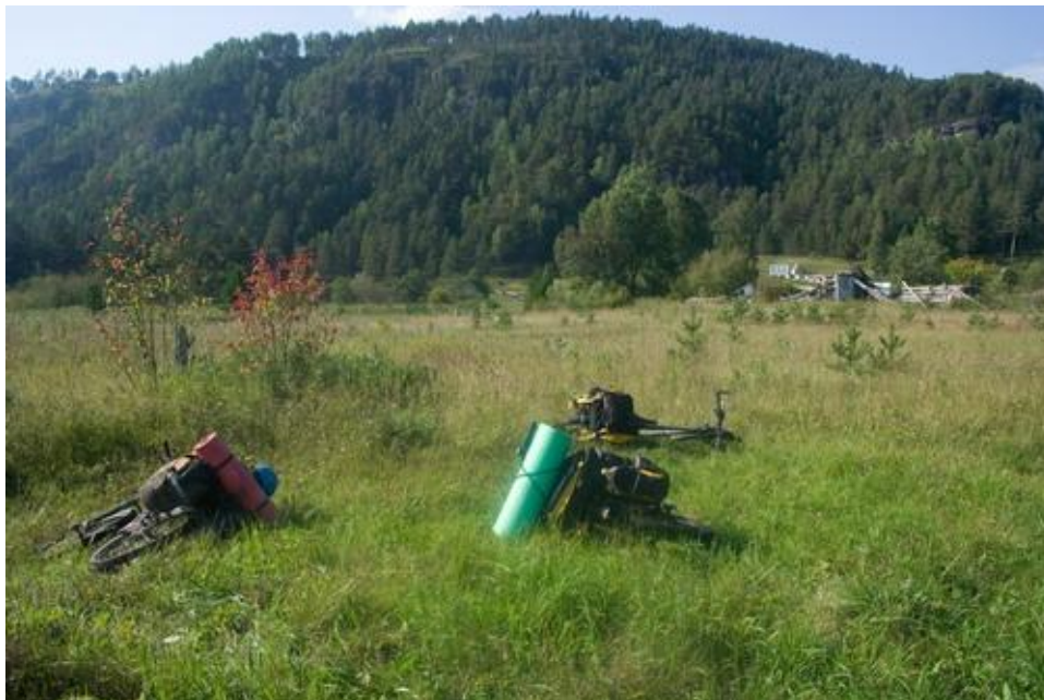
Фото№ 27 Зброшеный пионерлагерь