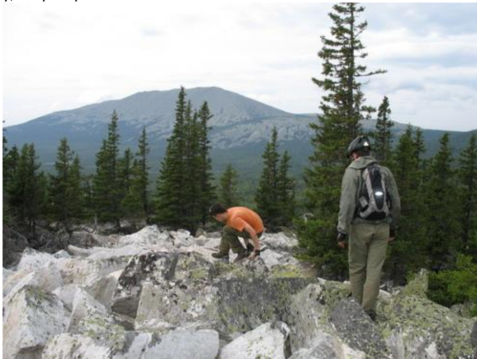
Фото №21 На малом Иремеле

В 14 часов спрятали велосипеды и пошли на плато Малого Иремеля, поели бруснику, чернику, голубику.