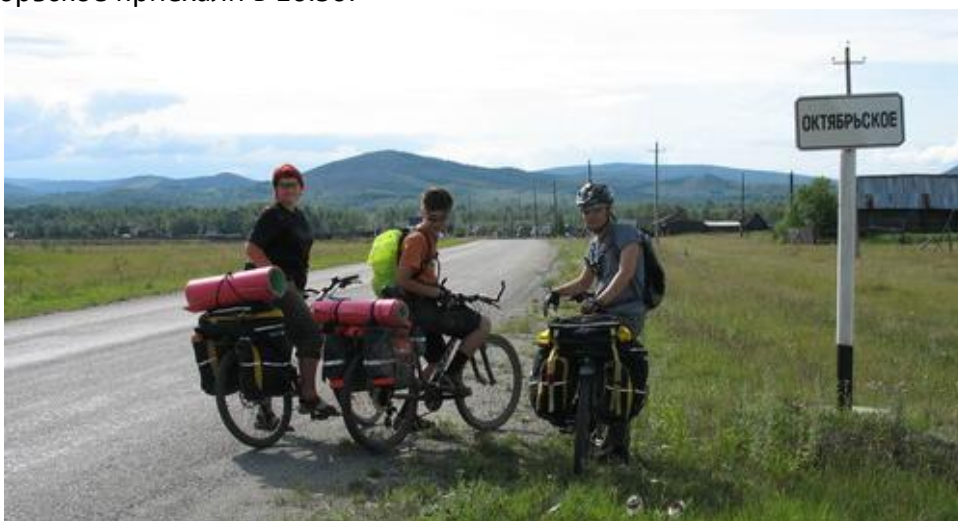
Фото №12 Октябрьское

В 13.15 пересекли М5 и хорошая, незагруженная авто асфальтовая дорога с указателями привела нас в пос. Ленинск, где мы устроили перекус. В поселке главная улица – заасфальтирована. В конце поселка асфальт переходит в грейдер, и дорога уходит на Октябрьское. У Виталика рвется тросик переднего переключателя – оперативно меняем. В Октябрьское приехали в 16.50.