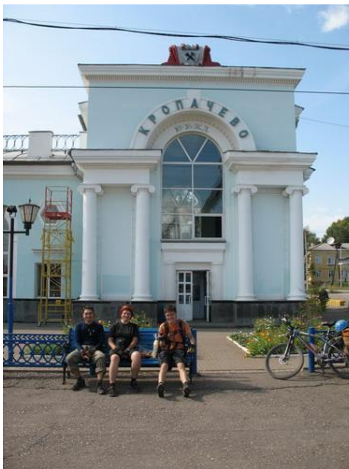
Фото № 32 Группа в Кропачево

В 15.30 группа прибыла на ЖД станцию Кропачево – конечный пункт активной части маршрута.