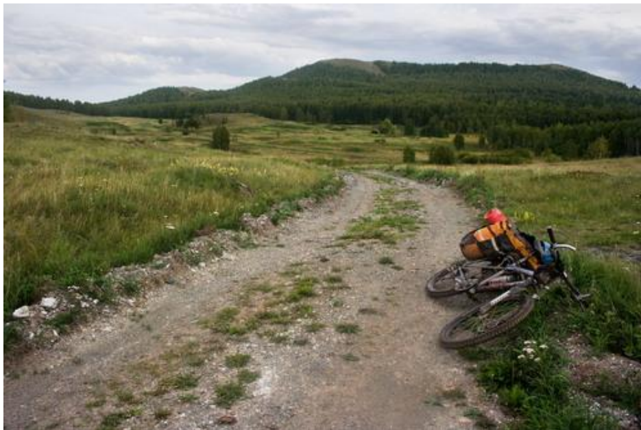
Фото № 13 В окрестностях хр. Нурали