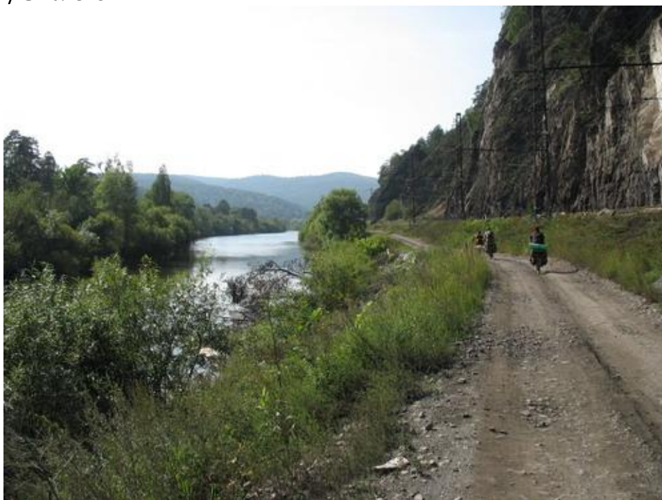
Фото № 26 Едем в пионерлагерь

В 16.30 приехали в поселок, и, разузнав у местных о заброшенном пионерлагере неподалеку, решили ехать туда на ночлег. Дорога, ведущая туда, проходит вдоль ЖД, потом туннелем пересекает ЖД и по долине ручья уходит на север до развилки, на развилке нужно повернуть налево.