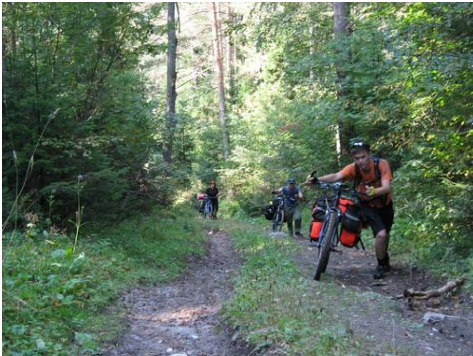
Фото №2 Подъем на седловину между хр. Малый и Средний Таганай