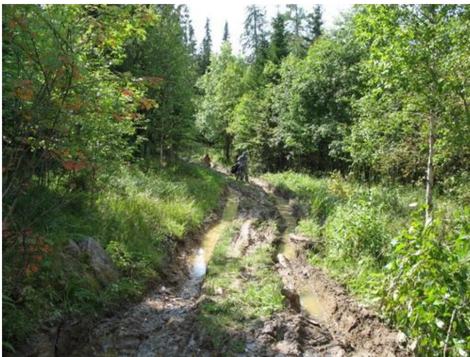
Фото № 3 Движение по дороге между хр. Средний и Малый Таганай

В 16.50 вышли к приюту Таганай и после перекуса, спрятав велосипеды, совершили радиальный пеший выход на вершину г. Круглица.