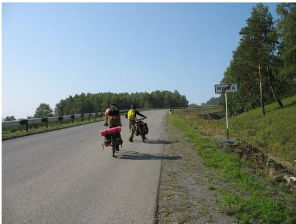
Фото№ 30 Выезд из Минки в сторону Усть-Катава

В 12 часов продолжили движение. 2 км по главной улице Минки и налево – в сторону Усть-Катава.