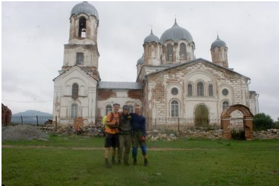
Фото №17 В Вознесенке