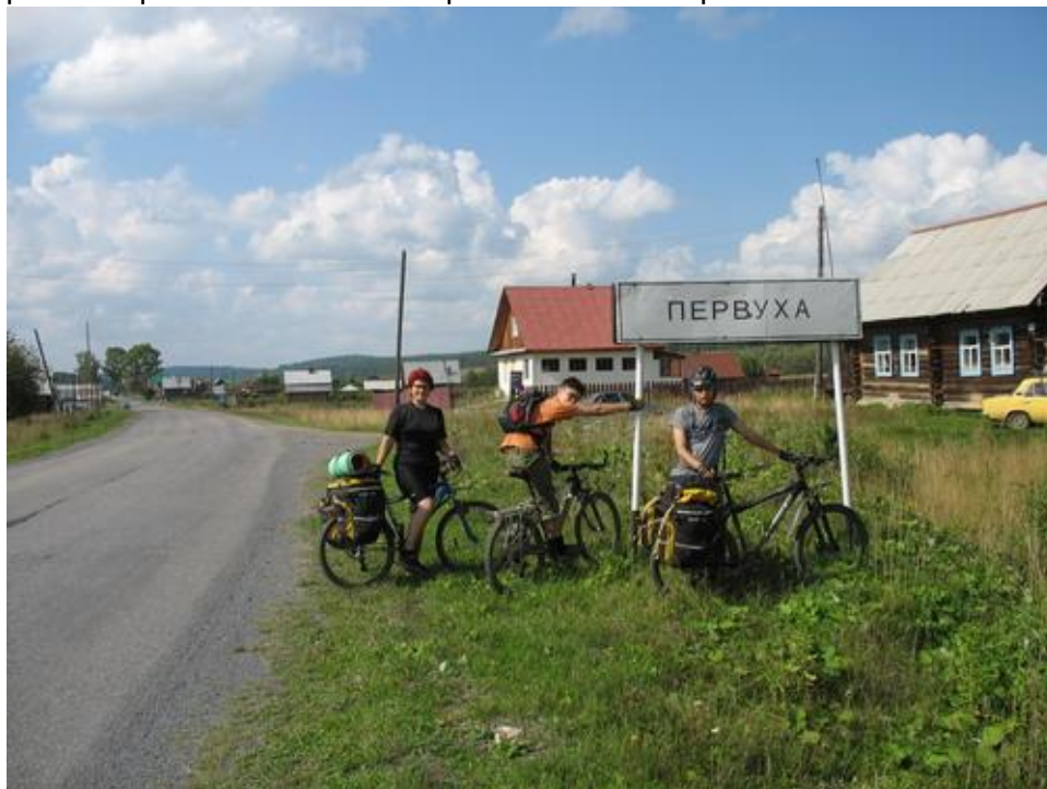
Фото № 24 Первуха

Этот день порадовал нас солнечной погодой. Выехали в 11 часов. Перед Меседой грейдерное покрытие сменилось асфальтом. За час проехали 15 км.