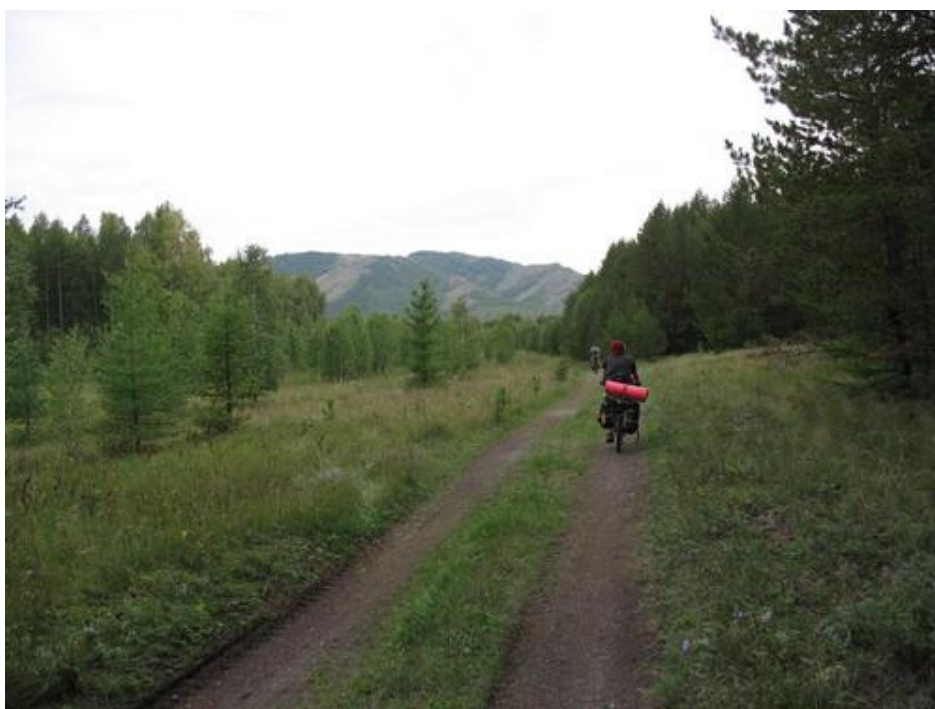
Фото № 14 На подъездах к Нурали