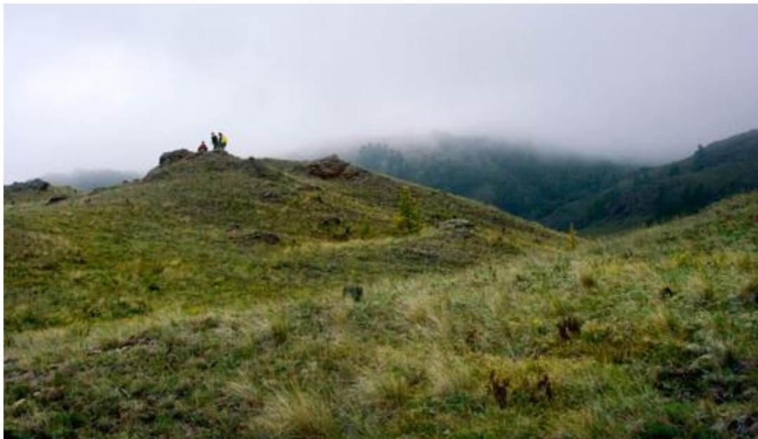
Фото №15 На Нурали

В 11.15 начали движение по дороге, пролегающей восточнее хребта. Моросил дождь. На подъезде к Шарипово Руслан прокалывает колесо. Быстро ремонтируем.