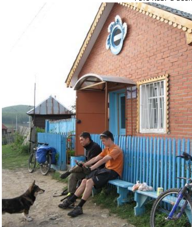
Фото №18 Магазин в Кирябинском