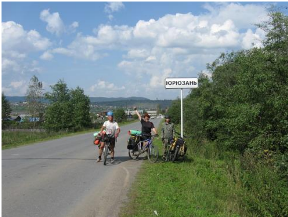
Фото №25 Юрюзань

В 16.30 приехали в поселок, и, разузнав у местных о заброшенном пионерлагере неподалеку, решили ехать туда на ночлег. Дорога, ведущая туда, проходит вдоль ЖД, потом туннелем пересекает ЖД и по долине ручья уходит на север до развилки, на развилке нужно повернуть налево.