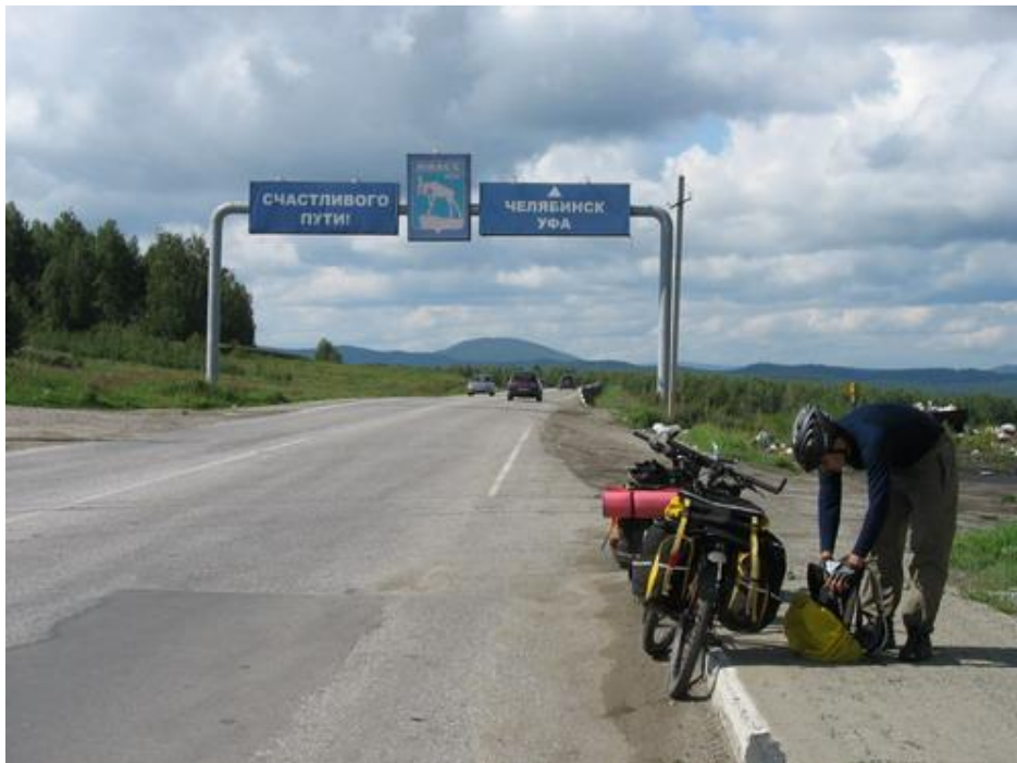
Фото №11 На выезде из Миасса

В 13.15 пересекли М5 и хорошая, незагруженная авто асфальтовая дорога с указателями привела нас в пос. Ленинск, где мы устроили перекус. В поселке главная улица – заасфальтирована. В конце поселка асфальт переходит в грейдер, и дорога уходит на Октябрьское. У Виталика рвется тросик переднего переключателя – оперативно меняем. В Октябрьское приехали в 16.50.