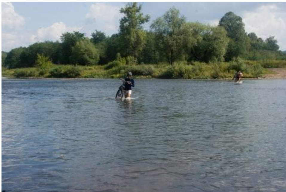
Фото №31 Брод р. Юрюзань