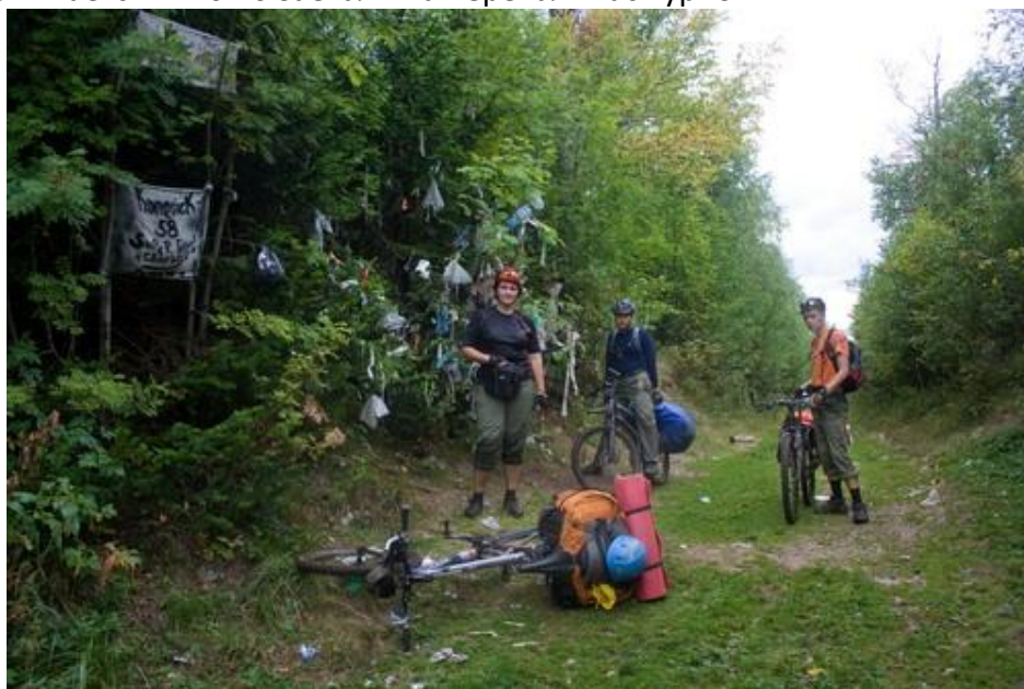
Фото №8 На перевале

Подъемы сменяются ровными участками с глубокими непересыхающими лужами. В сухую погоду ехать в седле можно почти везде. Есть развилки – примыкающие дороги заросшие, по основной же периодически ездит вездеходный транспорт, поэтому она всегда прослеживается. В 16.20 заехали на перевал. Пасмурно.