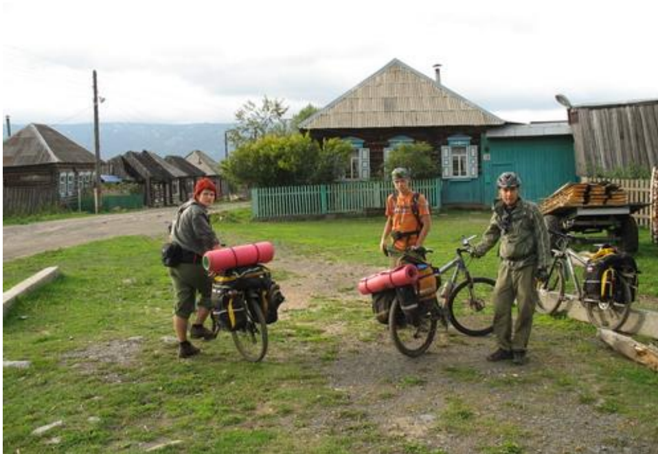
Фото № 23 В Тюлюке