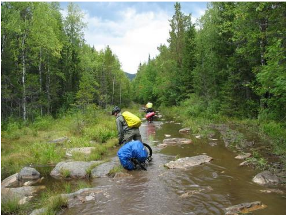
Фото №5 Дорога-ЛЭП

Вернувшись, набрали грибов – опять - коих в это время там изобилие. И в 21 час поехали к месту ночлега. В 22 часа разбили лагерь на просеке, близ р. Малый Киалим, не доехав до урочища Стрелка 1 км.