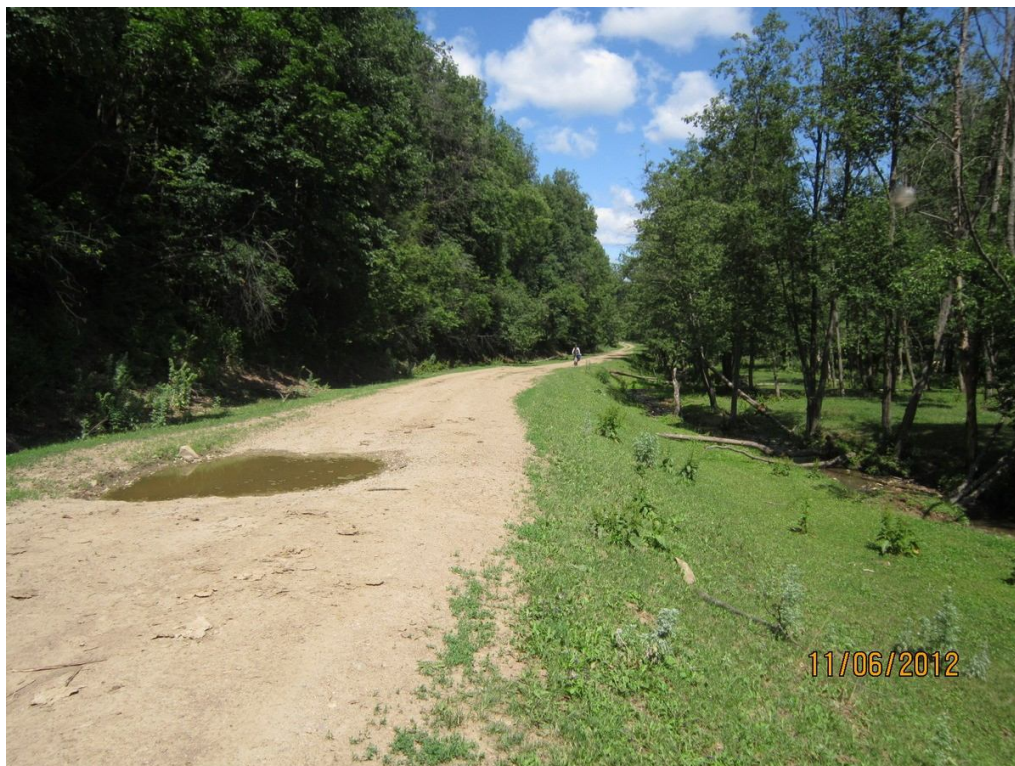
Дорога в Азово

Пройдя (почти весь этот отрезок мы прошли пешком) все эти чередующиеся лесные массивы с полянами вышли на грунтовку, ведущую в Азово. У этой дороги есть ответвление, которое ведет в сторону французской поляны, куда мы по плану и должны были направиться, затем перебраться Инзер и далее держать путь в сторону Габдюково. Но решили заехать в Азово для закупки продуктов, тем самым сделав небольшой крюк, и удлинив наш маршрут.