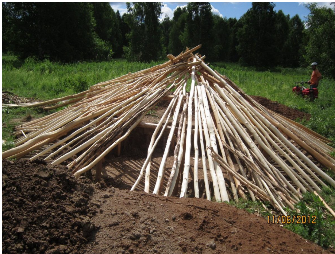
Непонятное сооружение в виде шалаша

Далее вплоть до самого Инзера маршрут представлял собой череду полян и леса. Лесные участки, как впрочем, и поляны были не очень затяжными. Но частенько чередовались друг с другом. Лес достаточно густой, с буреломом, нередко с оврагами и небольшой долей мордохлыста. Частенько приходилось перетаскивать велосипед через упавшие деревья и овраги, маневрировать между деревьями. В общем-то, ничего особенного, если бы не рои комаров и слепней постоянно жужащих рядом с тобой. Репеллента хватало максимум на полчаса из заявленных четырех часов. И через каждые 30 – 40 минут приходилось поливать себя химикатами с ног до головы. Гнус напрягал настолько, что первым желанием было побыстрее выбраться из леса на поляну. Таким образом, можно прийти к забавному выводу, что гнус является хорошим стимулирующим и подгоняющим фактором для прохождения лесных массивов со всеми его препятствиями.