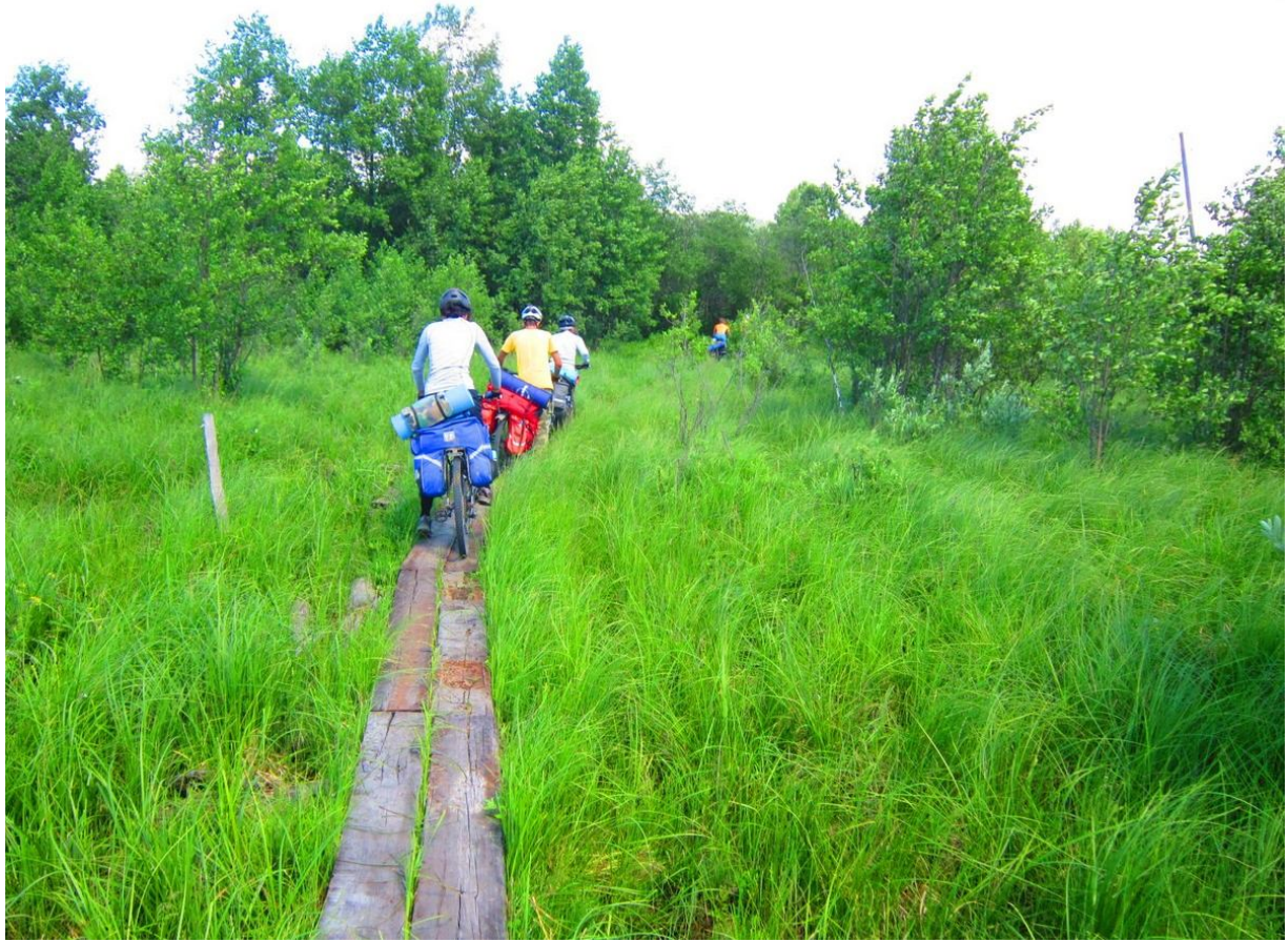
Фен-шуйная «велодорожка» в Азово

Докупив необходимые продукты, отправились на поиски уютной полянки перед Инзером для перекуса.