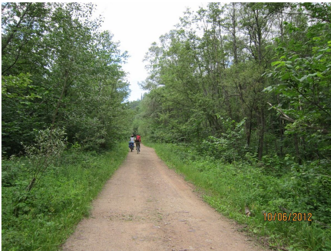
Дорога на Верхние Лемезы