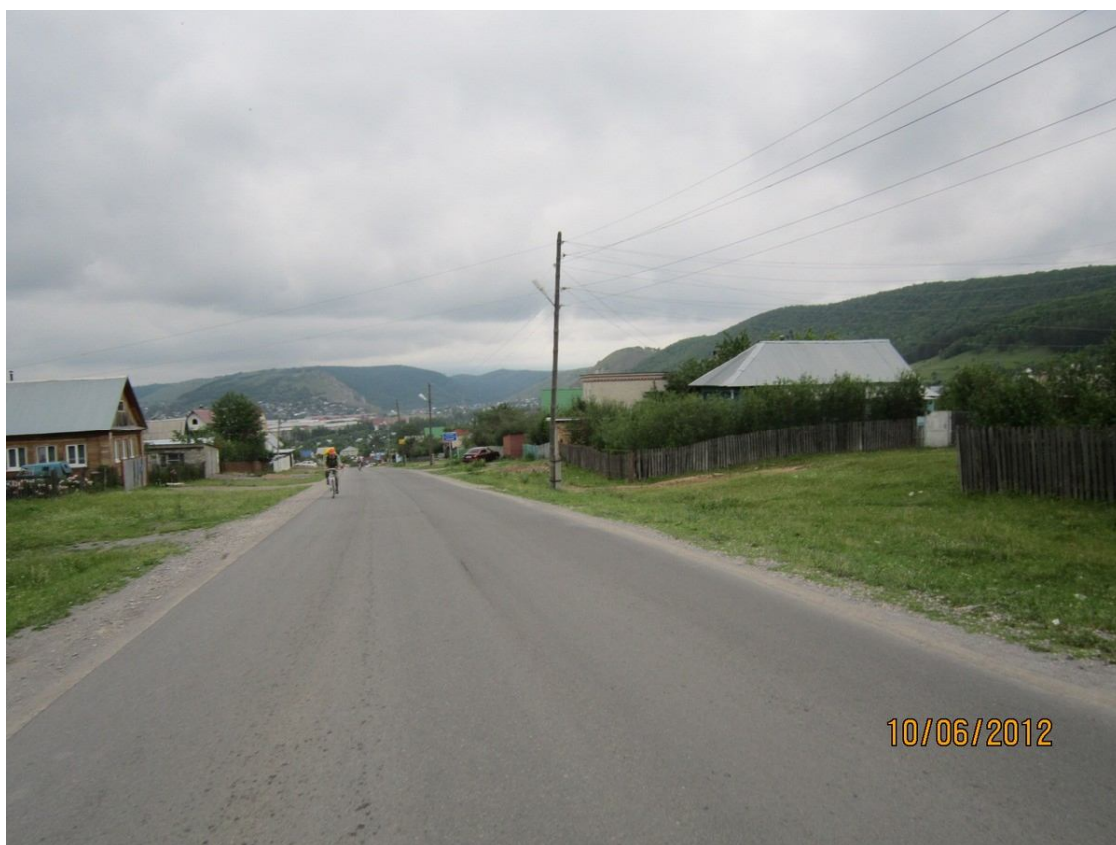
Начало пути. Асфальтовый матрас в Аше