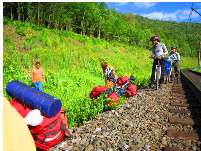
Езда по шпалам. Участок Азово – 71 км.