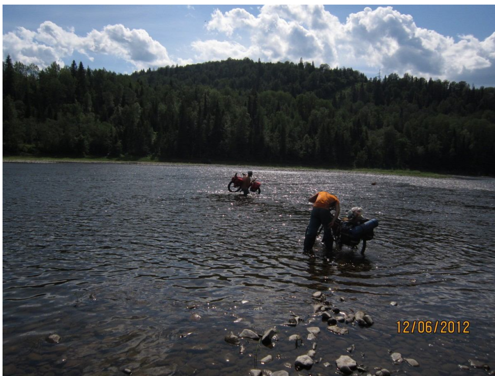
Брод Инзера возле Бриштамака

Пара-тройка бродов Инзера – и мы уже были возле Бриштамака. Последний брод Инзера оказался для меня крайне «веселым». Поскользнувшись на камнях, искупался вместе с велорюкзакom и велосипедом. В Уфу возвращался мокрым, чистым и довольным.