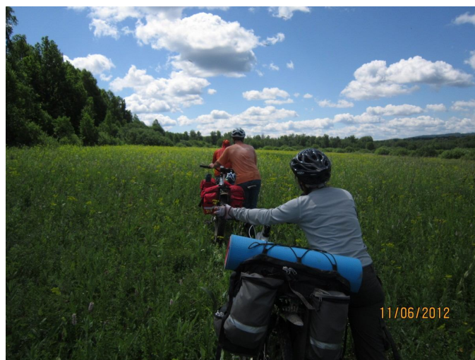
Полянки между Лемезой и Инзером