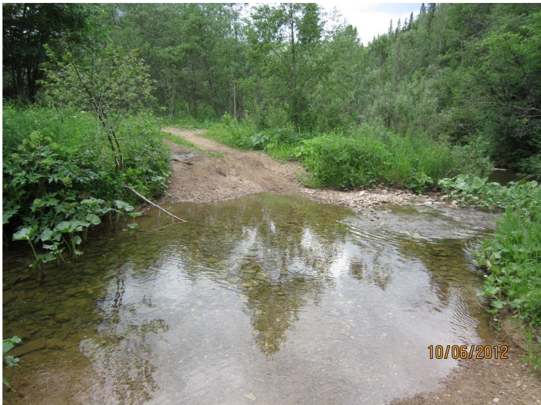
Один из первых бродов реки Икинь

Далее была серия бродов реки Икинь, которая извиваясь змейкой, периодически пересекает дорогу. Кажется, после третьего брода, наиболее протяженного, который я так и не смог преодолеть одним махом с разгона, застряв прямо по середине, мы сделали остановку на большой перекус.