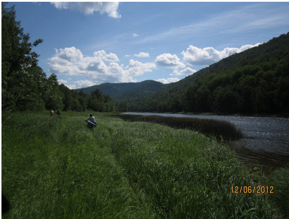
Гуляем по берегу Инзера

Последний участок маршрута проходил по живописным берегам Инзера.