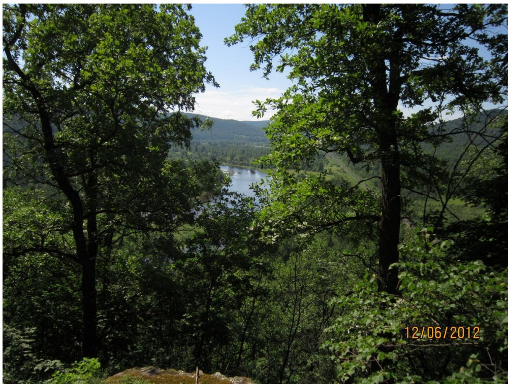
Над железнодорожным тоннелем на участке Габдюково - 71 км

В Габдюково заехали в магазин, докупили необходимых продуктов, набрали воды. Дальше по плану нас ожидало Зуяково, гравийная дорога до которого тоже оказалась из разряда трудно забываемых. Практически на протяжении 5 километров пришлось катить по булыжникам размерами с кулак, а нередко – и в несколько кулаков. Но с успехом выдержав все эти неудобства, и быстро проскочив Зуяково, по тропинкам шустро покатали дальше вдоль Инзера. Но, как обычно, все хорошее быстро заканчивается, и вскоре нам предстояла очередная езда по шпалам. То ли вчера укрепили «иммунитет» к езде по шпалам, то ли в этот раз было больше места для маневров, но сегодня это не произвело столь сильного впечатления.