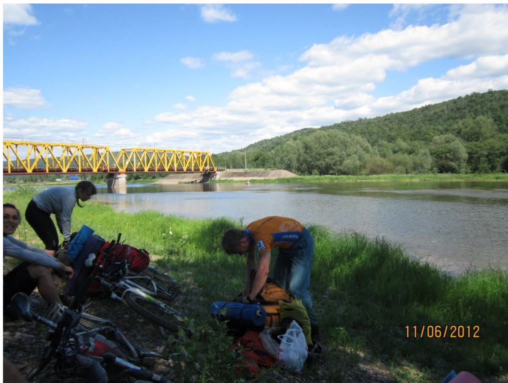
Большой перекус на Инзере

После этого было еще несколько небольших луж, но все они проходились «в седле». Вскоре добрались до железнодорожного моста через Инзер и здесь же присмотрели удобное местечко для перекуса. Первым делом отправились купаться. В итоге проматрасили часа полтора.