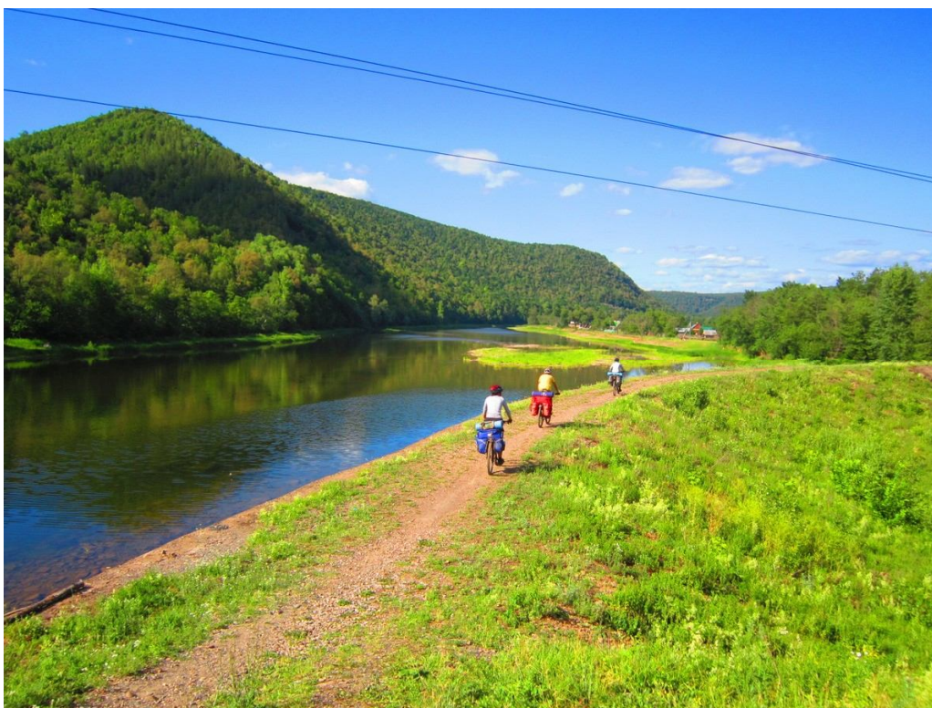
Катим вдоль Инзера и железной дороги за Азово

Далее переправились по железнодорожному мосту через Инзер и покатали вдоль железной дороги по грунтовке.