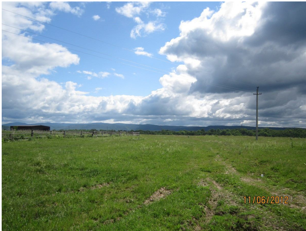
Полевая дорожка, ведущая в сторону Северюхинского

Проснулись примерно в половине седьмого утра, позавтракали, проверили велосипеды, собрали лагерь и отправились дальше в путь в сторону Инзера. Погода с утра была пасмурной, как и накануне, но облака на удивление рассеялись буквально за несколько минут. И к моменту нашего старта солнышко уже вовсю припекало. День обещал быть солнечным и жарким. От Верхних Лемезов до Михайловки ведет гравийная дорога. Доехав до поворота на Михайловку, мы свернули налево и двинулись по грунтовке в сторону существующего только на карте Северюхинского.