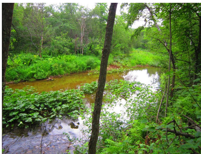
На пути к Верхним Лемезам

Все это безобразие внезапно закончилось полем перед Верхними Лемезами.