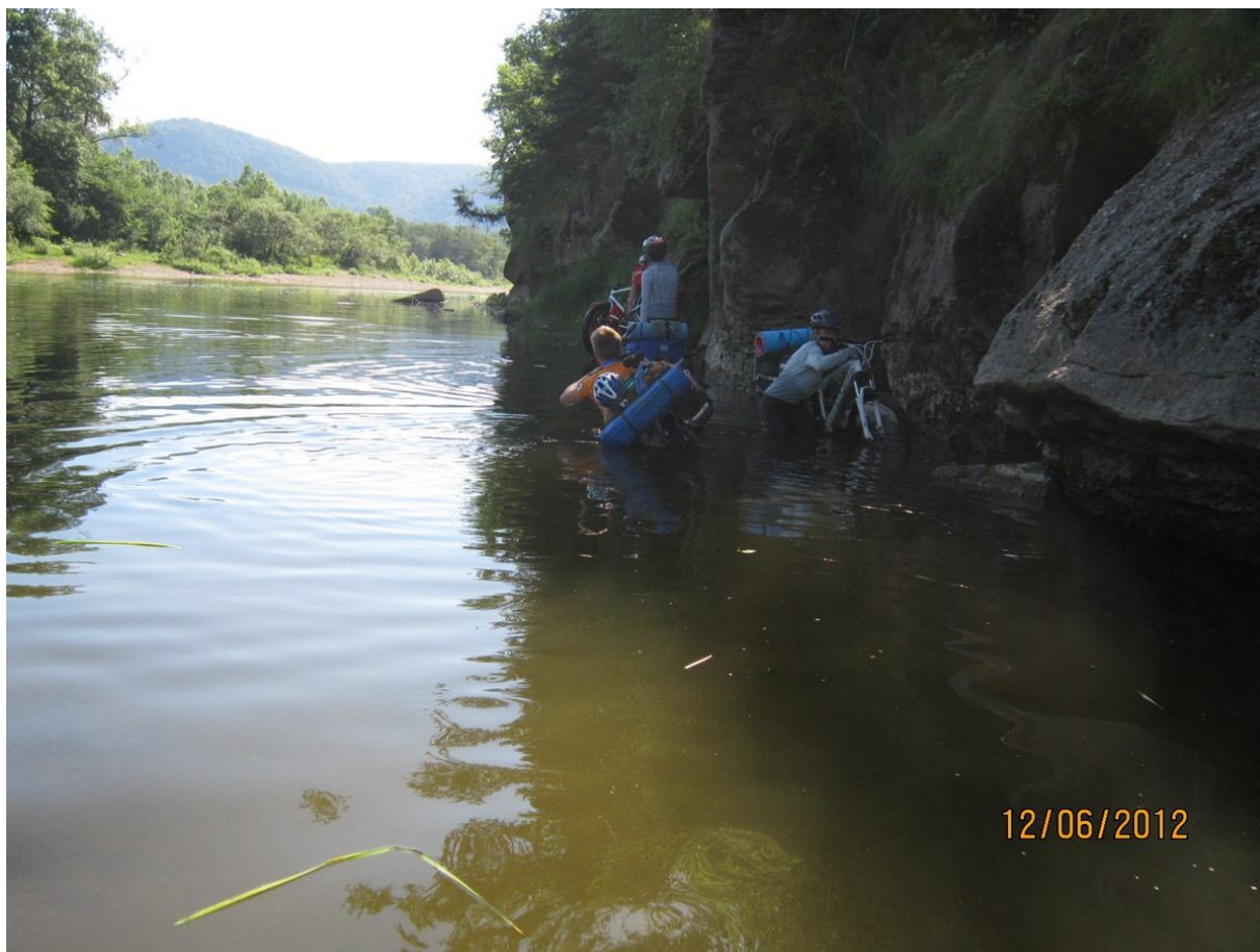
Прохождение прижима на Инзере

Проехав после старта несколько десятков метров по тропинке вдоль Инзера, столкнулись с вопросом прохождения прижима. Максимальная глубина Инзера на этом участке оказалась по пояс. Хотя, наверное, можно было найти и поглубже. У каждого была своя тактика прохождения данного препятствия. Но втулки мочить ой как не хотелось. Поэтому велорюкзак быстро оказался за плечами, а велосипед на шее.