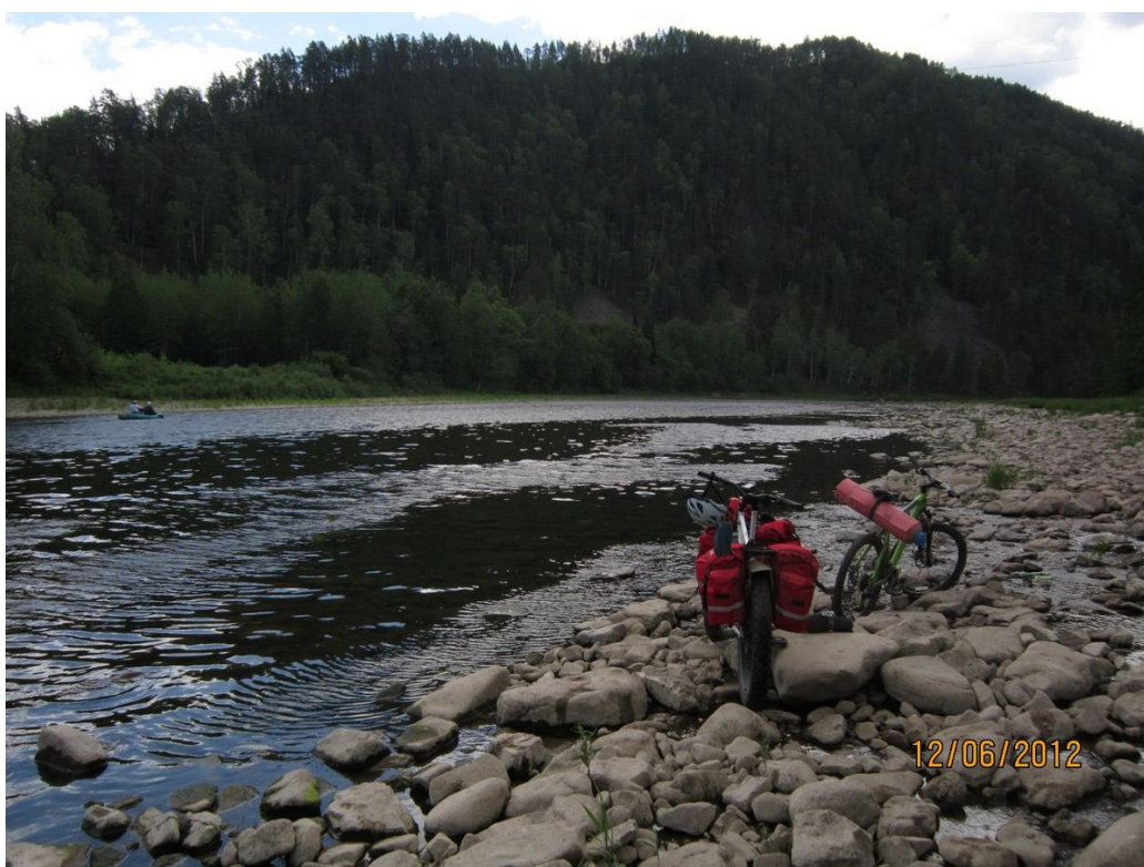
Матрас на Инзере

В Габдюково заехали в магазин, докупили необходимых продуктов, набрали воды. Дальше по плану нас ожидало Зуяково, гравийная дорога до которого тоже оказалась из разряда трудно забываемых. Практически на протяжении 5 километров пришлось катить по булыжникам размерами с кулак, а нередко – и в несколько кулаков. Но с успехом выдержав все эти неудобства, и быстро проскочив Зуяково, по тропинкам шустро покатали дальше вдоль Инзера. Но, как обычно, все хорошее быстро заканчивается, и вскоре нам предстояла очередная езда по шпалам. То ли вчера укрепили «иммунитет» к езде по шпалам, то ли в этот раз было больше места для маневров, но сегодня это не произвело столь сильного впечатления.