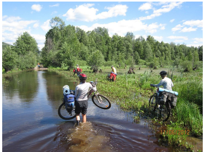
Преодоление болота в Азово